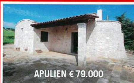
APULIEN € 79.000