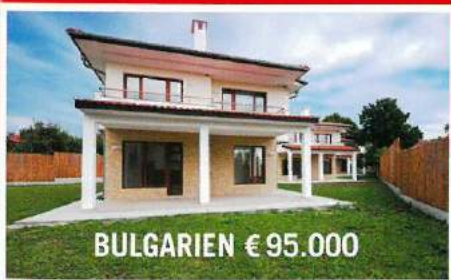
BULGARIEN € 95.000

SCHNÄPPCHEN-FESTIVAL: 100 HÄUSER UNTER 100.000 EURO