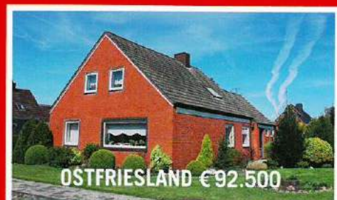
OSTFRIESLAND € 92.500